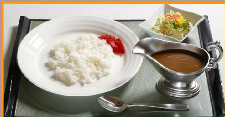
特製カレー ミニサラダ付 1,000円 (食事別)