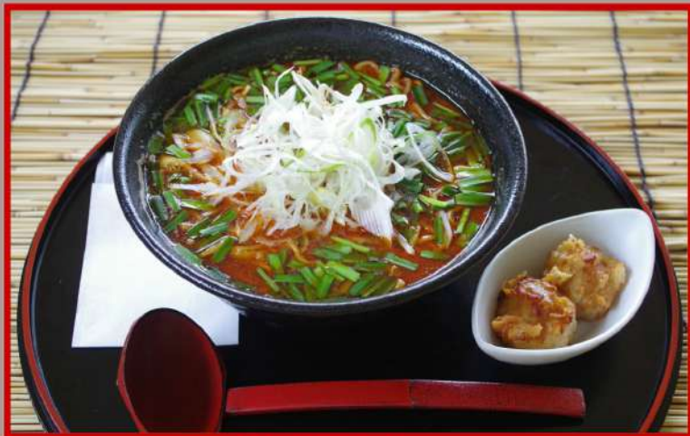
担々麺 (焼売付き) 1,000円 (食事別)