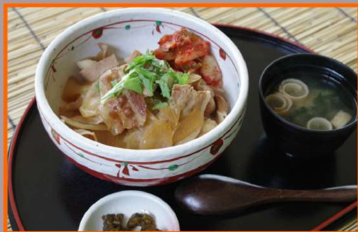
豚丼 1,000円 (食事別)