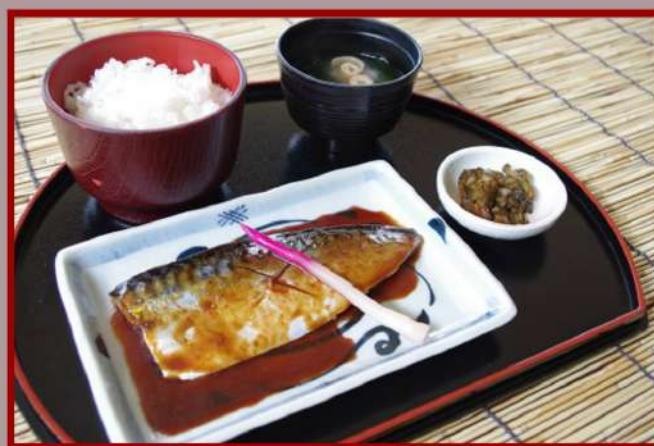
さば煮 定食 1,000円 (食事別)