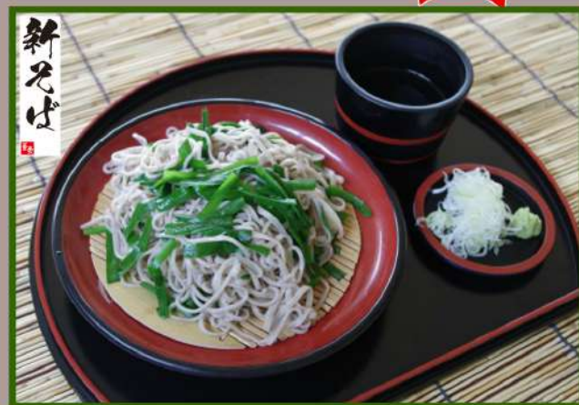
ニラ蕎麦 1,000円 (食事別)