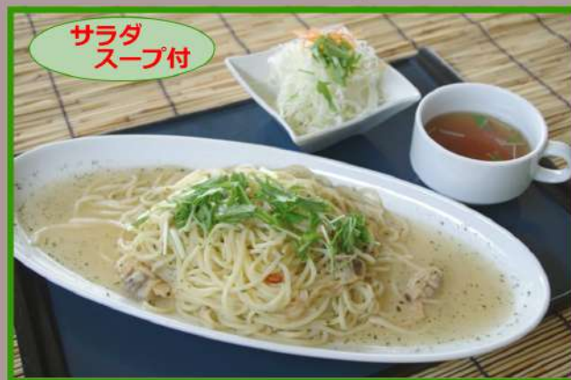
ボンゴレビアンコ 1,000円 (食事別)